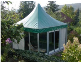
Pagode Glas und PVC