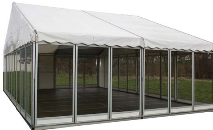
Traufseite mit Standardelementen